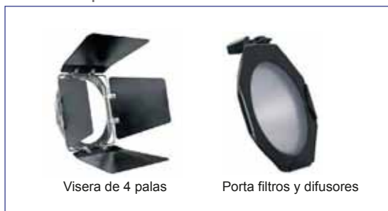
Visera de 4 palas